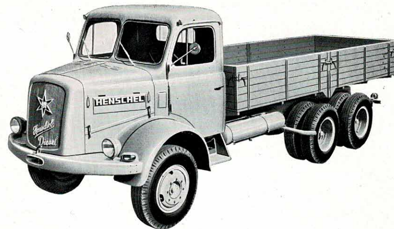
HS 3 - 125 Lastwagen